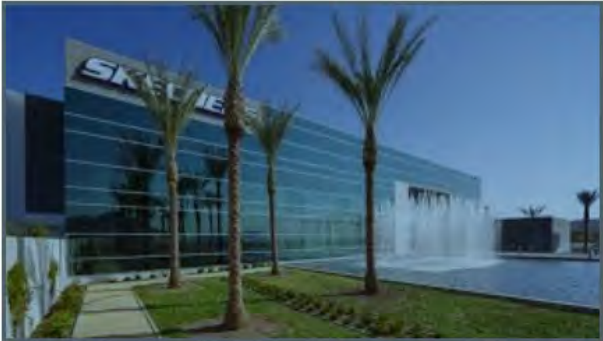
Close to 60 Freeway proposed World Logistic Center 40 Million Sq.Ft. Project and 20,000 jobs