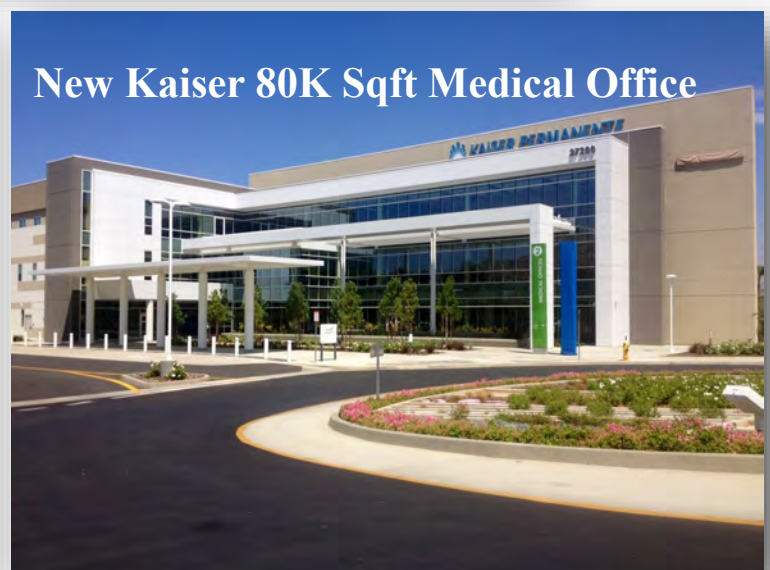
New Kaiser 80K Sqft Medical Office