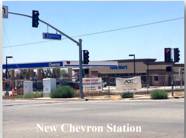
New Chevron Station